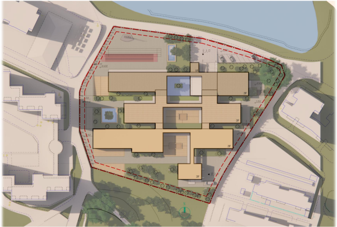
大二下學期所設計幼稚園的部分成果圖

我堅信我可以一步一步腳踏實地般全面發展，亦憧憬有朝一日能站在建築學大師的肩膀上仰望星空！